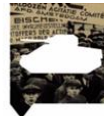
9 Tijd van de wereldoorlogen (1900 - 1950)