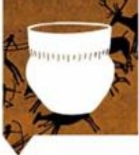
1 Tijd van jagers en boeren tot 3000 vC