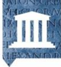
2 Tijd van Grieken en Romeinen (3000 vC - 500 nC)