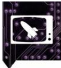
10 Tijd van televisie en computer (vanaf 1950)